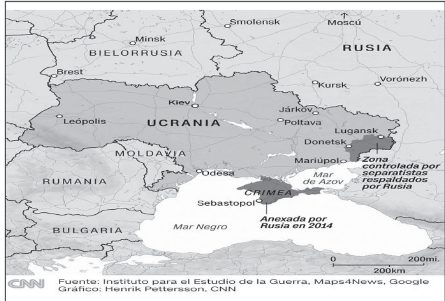
MAPA 2. LOS CONFLICTOS Y TOMA DE TERRITORIOS DE DONETSK Y LUGANSK.