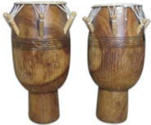
Atunglan (de distintas formas)