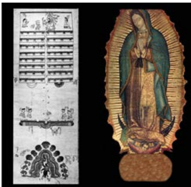
Figura 1 El Códice Selden I y la Virgen de Guadalupe del Tepeyac

Nota. Adaptado de Los códices mexicanos de época colonial (p. 38-39), por C. Martínez, 1994. Elaboración propia, 2023.