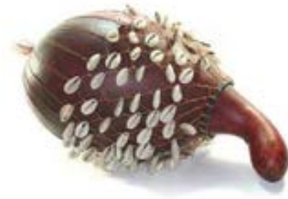
Trompeta (flauta) o Ahè