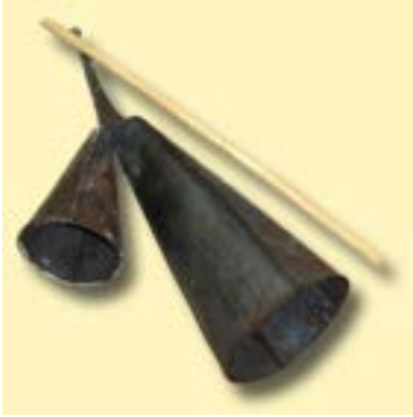
Doble campana o Bin